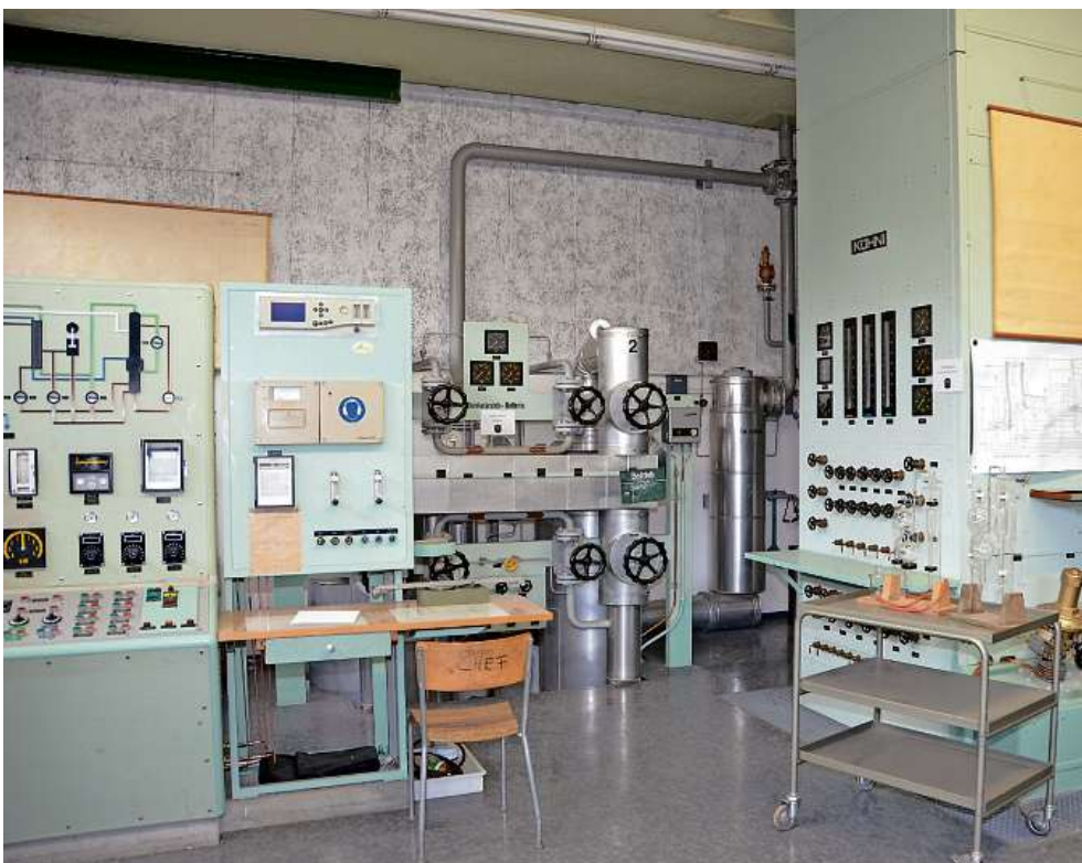
Die Maschinen in der Lufttrennanlage der Armee in Ilanz stehen seit 2005 still.

Weitere Informationen: www.sauerstoff-fabrik.ch