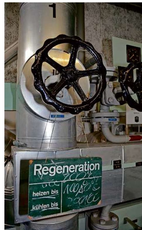
Es gibt viel zu entdecken bei den Führungen.